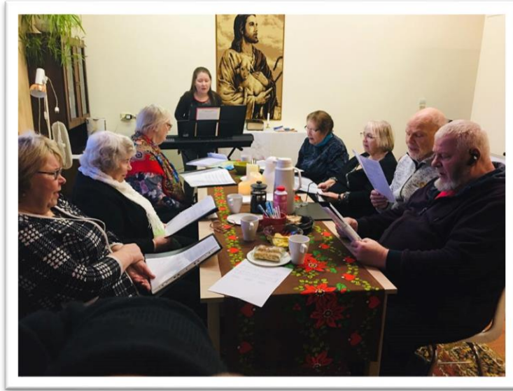
Talvella 2020 iloisia laulajia